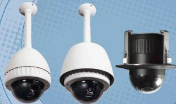
HSGN-502 HSGN-502SH HSG-502F